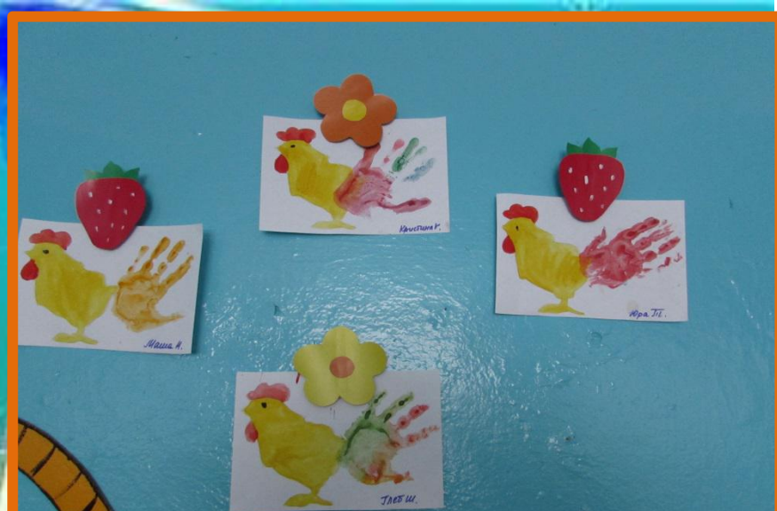
НОД «Хвост для петушка» Рисование ладошкой