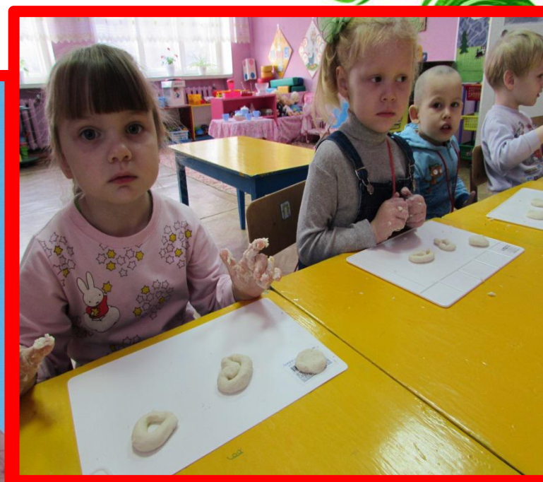
НОД лепка из солёного теста «Баранки ,калачи»