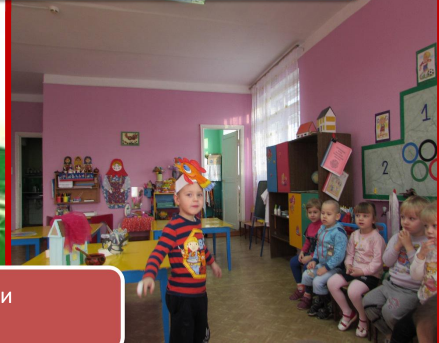
Обыгрывание потешки «Петушок, петушок»