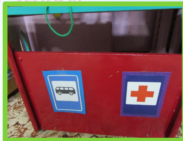
ОСТАНОВКА ОБЩЕСТВЕННОГО ТРАНСПОРТА