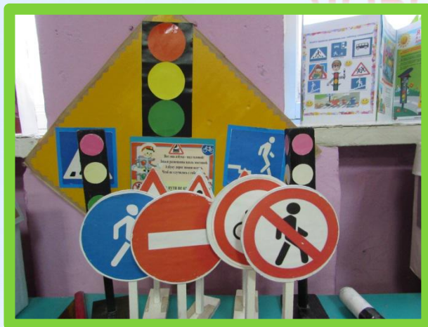
СВЕТОФОРЫ :ТРАНСПОРТНЫЙ И ПЕШЕХОДНЫЙ